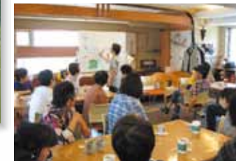
あじさいのミーティング