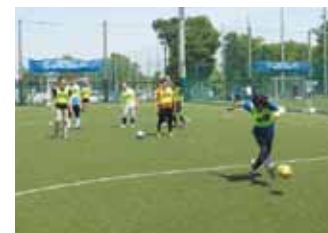
こもれびのフットサル

パソコン初心者を対象にWordの学習をしています。初めての方や、興味のある方はどうぞ。