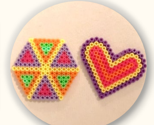
ものづくり アイロンビーズ ステンドグラスづくりなど