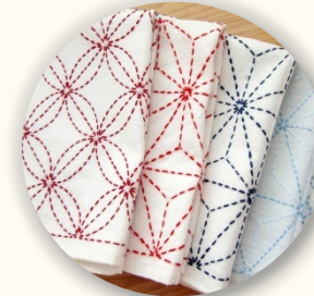
裁縫クラブ 刺し子布巾づくり