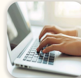
パソコン講座 初心者の方歓迎