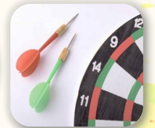
レクリエーションで 仲間と交流