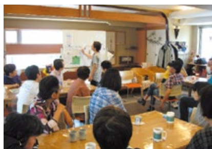
あじさいのミーティング